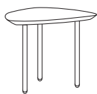
1618A h460 . d5100 . w550

Minimalismus, Geist und ein aktuelles Design für die Tische, die frischen Wind in jeden Raum bringen. Niedrig und breit oder hoch und schmal, wählen Sie ihren Favoriten aus und spielen Sie mit den verfügbaren Farben. Eos lässt Ihrem Spaß am Einrichten freie Hand.