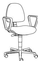
195859 h1000 . d620 . w620