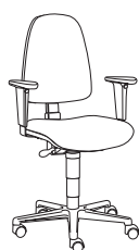
195359 h1100 . d620 . w620