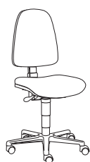
195259 h1100 . d620 . w620

Vintage pur. Gedacht für Fans der 70er und 80er Jahre garantiert Synchron Jolly einen fast absoluten Minimalismus, der die Vergangenheit dank einer starken Ausstrahlung zum Leben erweckt. Nur die Ausstattung mit einer extrem sorgfältig konzipierten und hochmodernen Mechanik bringt uns schnell in die Gegenwart zurück.