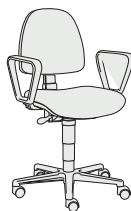
195859 h1000 . d620 . w620