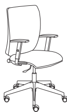
178551 h1090 . d670 . w670