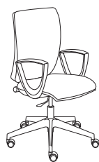
178571 h1090 . d670 . w670