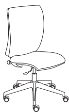
178501 h1090 . d670 . w670

Mit den gleichen Eigenschaften des kleineren Bruders ist Sprint X eine echte Hilfe, wenn wenige Zentimeter mehr den Unterschied für eine korrekte Haltung ausmachen. Mit einer größeren und umhüllenderen Rückenlehne bekommt ein Stuhl, der für den operativen Einsatz geeignet ist, das gewisse Etwas.