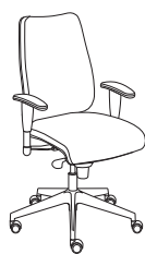
53732 h1105 . d680 . w680