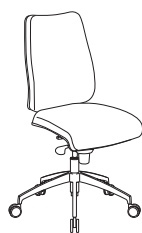
53721 h1125 . d680 . w680