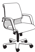
2842 h1000 . d670 . w640