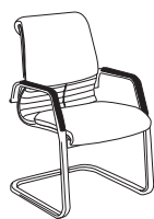
2880 h920 . d670 . w595