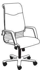
2812 h1220 . d700 . w700

Die Armlehne ist ein Element, das Klasse und Eleganz ausstrahlt und den Kontrast von Verchromungen und weichem Bezug hervorhebt. Die im oberen Bereich gewellte Rückenlehne beschreibt perfekt die Seele dieses Stuhls. Eleganz für den Arbeitsplatz und das gewisse Etwas für den Raum.