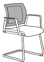
55272R h855 . d575 . w640