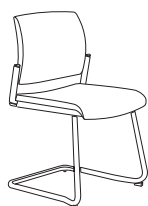
55270 h855 . d575 . w540